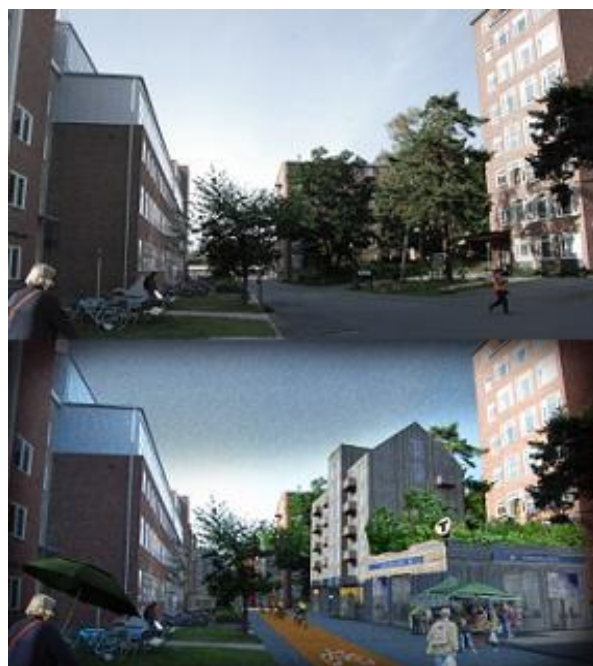
Illustration: Samuel Rizk

Vi föreslår att den gröna tunnelbanelinjen förlängs med en gren från Odenplan till Hagastaden/Karolinastaden. Tillsammans med satsningar på prioriterade cykelstråk och en tät, integrerad stadsmiljö i mänsklig skala, med absolut närhet till de flesta av vardagens hållpunkter, möjliggör vi en bilfri vardag för dem som bor och arbetar i stadsdelen. En ekodukt skapar en grön bro över motorvägen till Hagaparken. Bilpooler finns för de tillfällen då behov verkligen finns och varutransporter och färdtjänst får självklart ta sig fram längs gårdsgatorna i samma hastighet som gående. Kraftigt sänkta parkeringstal sänker byggkostnaderna (garage under hus är dyra, parkering på mark kräver mycket yta, vilket också blir dyrt) och därmed också sluthyran för de boende.