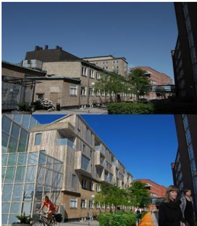
Illustration: Samuel Rizk