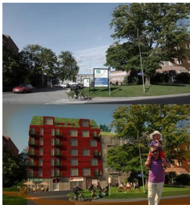
Illustration: Samuel Rizk

Vi föreslår en tät stadsdel i innerstadsskala, men med generösa sammanlänkade parker och gårdarum, trygga för barn att röra sig mellan. Flexibla lokaler finns mot alla gator och publika platser ger staden en möjlighet att leva och utvecklas över tid. Här kan människor vistas, leka, fika, samtala, anordna marknader, dela ut flygblad, mm. En ickekommersiell mötesplats, men med möjlighet till handel och kommers. Små tomtstorlekar möjliggör för mindre byggaktörer att delta, vilket kan pressa priserna och därmed hyrorna.