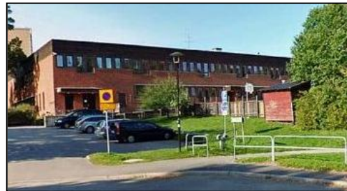
Fridhemsskolan i Hagalund, med 200 elever, läggs ned av Solnas borgerliga politiker.